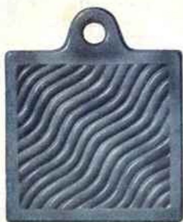
CGB - Gris bleuté