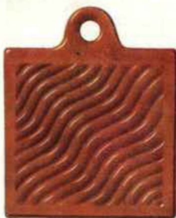
CB - Brun