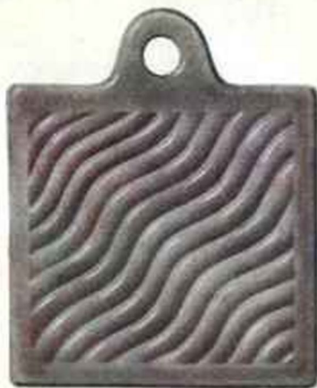
CGC - Gris castor