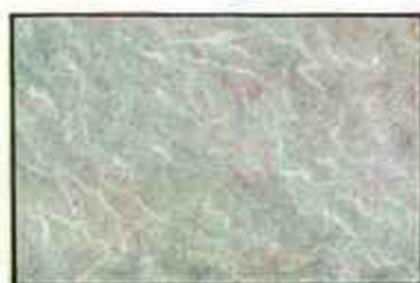
CGB - Gris bleuté