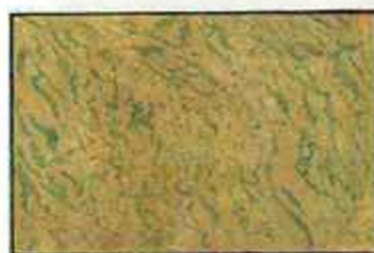
CB - Brun